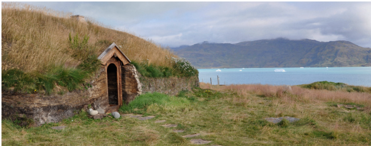
Augusti | Qassiarsuk

Noorliit kinguariartulernerat piffisami sivisuumi Kalaallit Nunaanni savaqannginnerata aallartiffigaa. Tamatumunnga ilaatigut ("Den lille istid") 1300-kkunniit 1850 missaata tungaanut sermersuaqarne-rata aallartinnera pissutaavoq. "Den lille istid" suli oqallisigineqartarpoq, tassami piffissami tassa-ni nunarsuup affaa avannarleq minnerpaamik pingasoriarluni issinnerpaaffeqarpoq. Taamaattumik "Den lille istid" piffissaq tamakkerlugu isserujussuarneq ajorsimavoq, silalli pissusaa allanngorartuu-simalluni ukiuuneranilu isserujussuuartarsimalluni.