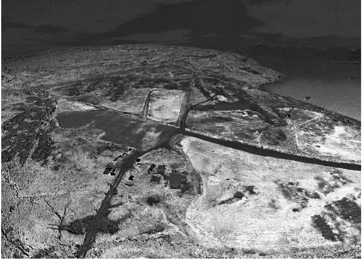
Quppernerup akiatungaani: Dronimik assilisaq, narsaatit qanoq innerannik assigiinngisitaartunik erseqqissumik takutitsisoq. Uani narsaatit killuiffiusimasut, taakkunanilu naqqilersut panersimasullu assigiinngissusaat erseqqippoq. Qulaani asseq taassuma assigaa, naasoqarsinnaanerata assigiinngisitaarsinnaanerani takutitsisinnaanngorlugu aqqissuussa. Qaqortut tassaapput naasoqarluartut, qernertullu naasoqannginnerullutik.