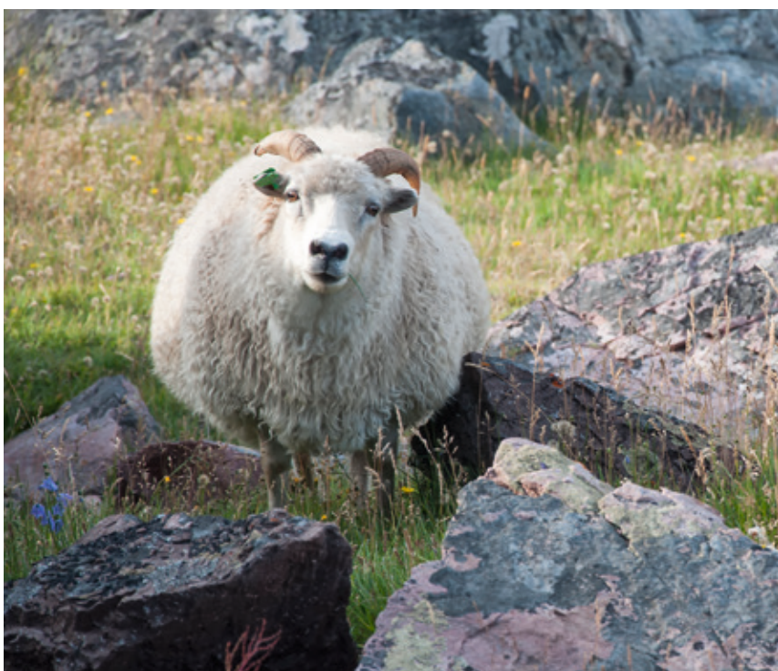
Augusti | Igaliku

Savaateqarneq qangaaniilli Kujataani inuussutissarsiutaalluarsimavoq. Tamanna nunap ilusaatigut takuneqarsinnaavoq, minnerunngitsumik ungalut ilisarnartut ivikkallu ukiumut nerukkaatissat poortukkat takullugit. Qulaani takuneqarsinnaavoq nunami savat amerlangangata siunertaanngitsumik nuna neriorneqarsinnaalersarpoq. Naasut ilaat narsaatit eqqaanni naasartoq tassaavoq inneruulap aappa (høgeurt) (Hieracium sp., quppernerup siuliani), Kujataani takussaalluarpoq, narsaatillu sinaanni sivingasunilu naagajuttarluni. Kapitalip uuma saqqaani assiliaq tassaavoq ullaakkut kanerera inneruulap aappaata kingunissaanniittoq.