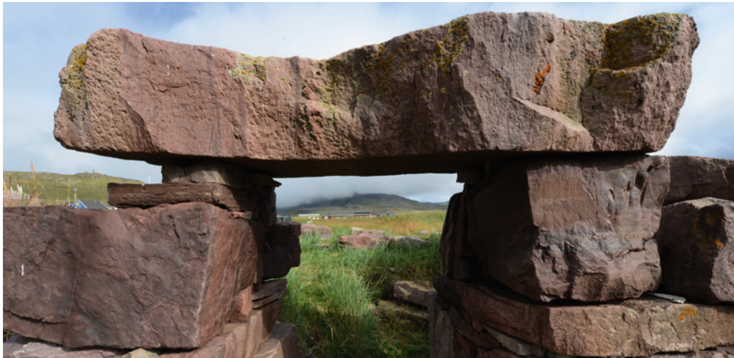
Augusti | Igaliku

Noorliit naggorissaasuvisuusimapput. Savaateqarlutik, nersussuaateqarlutik, savaasaateqarlutik, puulukiuteqarlutillu hestiuteqarsimapput. Ivikkanik naatsitsiviit illunut qaninnerit aasakkut ungalulersortarsimavaat, nersutit isermaveerlugit, aasap naajartornerani ivikkat killorlugit ukiumi nerukkaatiginiassagamikkit. Taamaammat savat aasami ivikknik naatsitsiviit avataanni qaqqani nerisinaasatik nerisararsimavaat. Aasami savaaqqat qassit qaqqani uummaannartarnerisut aammalu ivikkat qanoq annertutigisut ukiumut pissamaatigineqarsinnaanersut savaateqarnerup tunngavigisimavai. Tamannalu ullumikkut Kalaallit Nunaanni savaateqarnermi nutaaliaasumi suli atuuppoq. Ullumikkut naggorissaatit fabrikkini sanaat najugarisat qanittuini atorneqartariaqartarput, nerukkaatissallu kimittuut uumasuuteqarnerup pissarsiffiunerpaanissaa qulakkeernissaalu siunertaralugit nerukkaatigineqartarlutik.